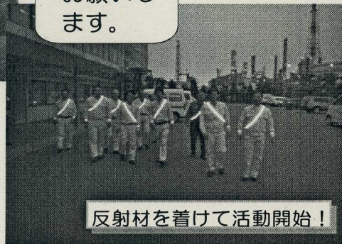
反射材を着けて活動開始！

通勤などで夜間に道路を歩行することが多い企業の代表者を「キラットリーダー（夜光反射材着用推進リーダー）」に指定させていただき、夜光反射材の着用の推進と、夜間の交通事故防止にご協力いただいております。