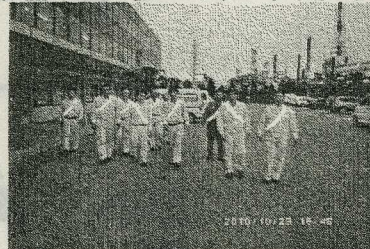
↑薄暮時に撮影したものです。よく見えますね。 (反射材着用例)

また、交通事故の多くは交差点での一時停止無視や、信号無視、巻き込み確認を怠ったものによるものです。