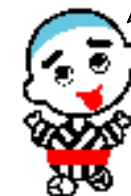
こにゅうどうくん

健康づくり課 TEL 354-8291 詳しくは、四日市市役所ホームページにて ⇒ http://www5.city.yokkaichi.mie.jp/