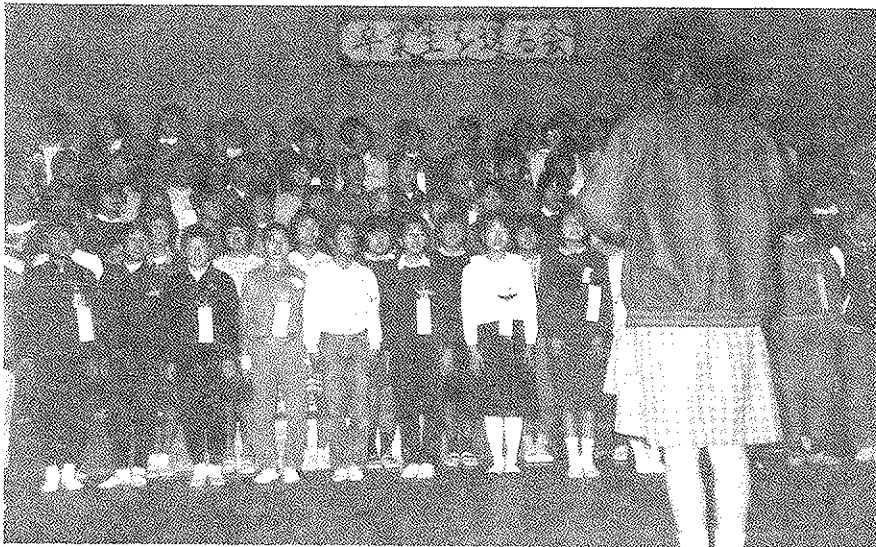
3月9日 卒業生を送る会、それぞれの思いは……