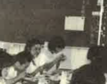
矢のように六年間が過ぎました。さあ中学に向かって出発。勉強にスポーツに思いきり頑張ってください。