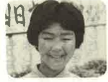
真栄城 忍 小学校とも、も うすべお別れ。お せわしてくださ つた先生方ありが うございました。

卒業おめでとう。常に「相手の立 場」に立つて考える「広い心」の持ち主 の女性になつてほしいと思います。