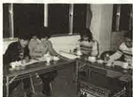
楽しい楽しい(?)編集会議

★広報部をあずかつて早一年。独断と偏見で遮二無二下き進んできました。下駄箱PTA」と陰口される昨今のPTA活動ですが、そういうところこそ本音があるものと勝手に決め込んで、意見の吸い上げを図ってきたつもりです。勇み足もありましたが、先ずは無難に終えたことまたまた独断。皆様の御協力に唯々感謝。