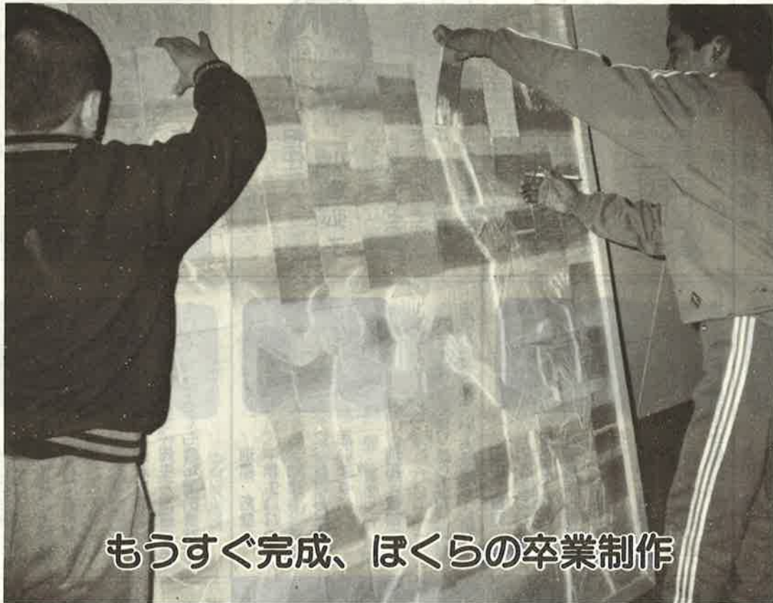
もうすぐ完成、ぼくらの卒業制作