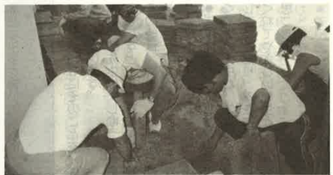
プロはだし(?)の平板並べ

梅雨入り前の六月八日、午前の親睦ソフトボール大会に続いて午後から、多数の会員の参加のもとに、校庭および周辺の環境整備が行われました。陶芸教室前の平板プロック並べ、米洗川堤防の草刈り、プール周辺の草取り、学習園の耕作作業等々暑い中の仕事でしたが、皆様の御協力により無事終了することができ、見違えるように環境が整備されました。