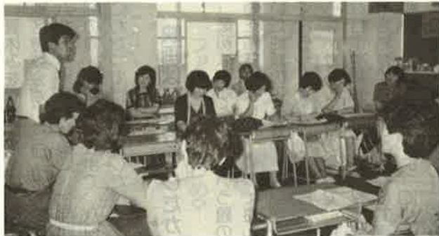
多勢の参加者で先生も熱が入ります

事あるごとに雨にたたられる羽津北小の行事ですが、この日もやっぱりあいにくの雨でした。二年生になって最初の授業参観、まだあどけなくて一生懸命で子供なりに一年間の成長のあとがうかがえる授業風景でした。そして問題の懇談会。もう少し参加人数が多ければなと残念な気もしましたが、子供のクラス仲間意識、「帰ってからの遊びと行動、それに伴う親同志の付き合い方」、「宿題の有無あれこれ」、「集団登下校時のいじめにあった苦労話」、「学校通信のほのぼのエピソード」、「先生から見た