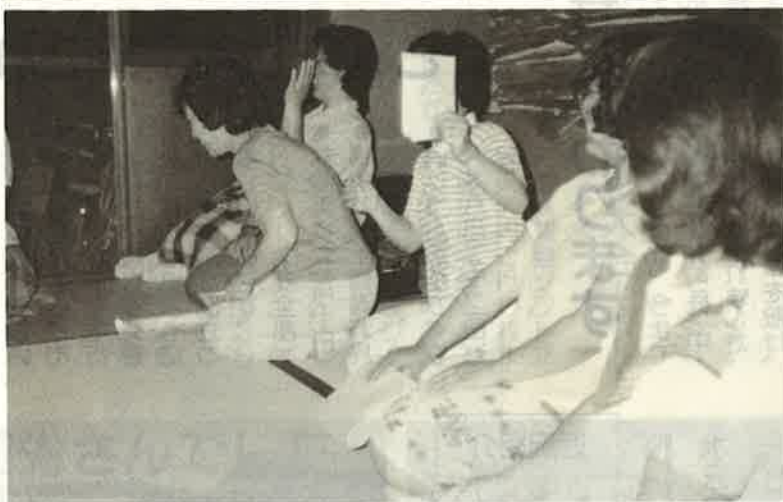
撮らないで——何故か、皆さん写真を敬遠されます。