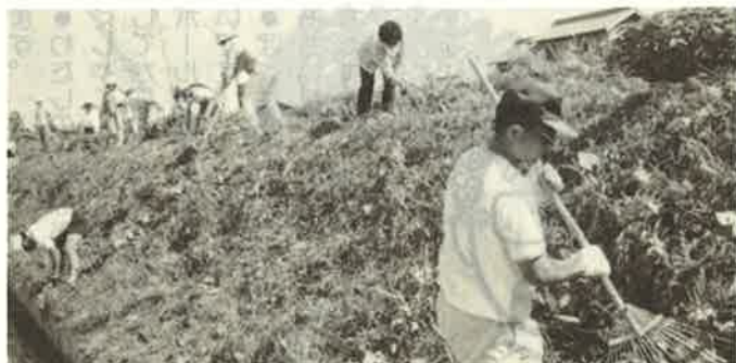
まむしはいないだろうな

次回は八月末に側溝清掃を予定しています。子供達が北小学校でのびのびと勉強し遊べるような環境を整えていくために、今後とも会員の皆様の御協力をお願いします。