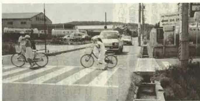
交通安全教室—市道での実地練習は真剣です。