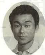
担任 城 吉基

「卒業おめでとう」でございます。みなさんとの出会いから、はや一年の月日がたとうとしています。私が羽津北小に赴任して、初めて出会ったのがあなたたちで、教室で騒いでいる時の声の大きさは圧倒されました。そんな元気な君たちと共に、いろいろな思い出を作ってきました。雨の中を歩いた遠足、飯ごうで炊いた自然教室での朝食、騒いで眠れなかつた修学旅行の夜……。思い出は尽きません。長い人生のうちで、この六ヶ年ほど純粋で楽しい時代はそうないことでしょう。そんな大切な時期に、しかも五、六年生の担任としてかわらせて頂いたことを光栄に思います。