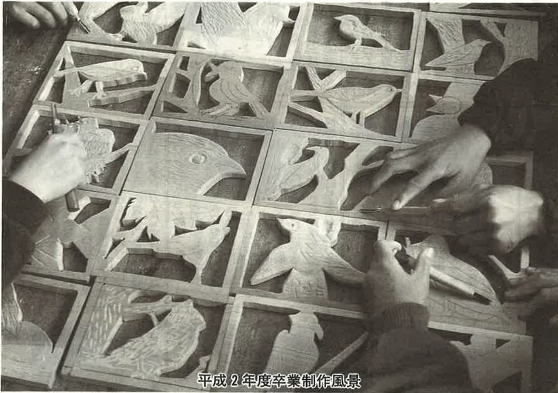
平成2年度卒業制作風景