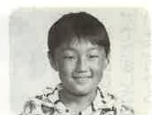
藤井 寿 中学校に行ったら新しいスタートとして友達を作り、また、勉強や運動をがんばろう!!