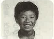
六代 滋 六年間通った羽津北小。中学校に入っても思い出を胸にクラブ活動などに努力します。

卒業おめでとう。お父さん大変寂しい思いがします。それはあなたが大人になる一歩手前であるから末娘よ。