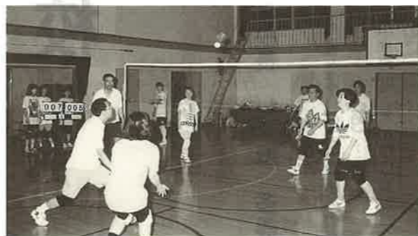
毎週土曜日、皆さん参加下さい!!