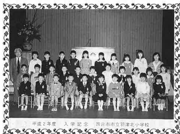
平成2年度 入学記念 四日市市立羽津北小学校