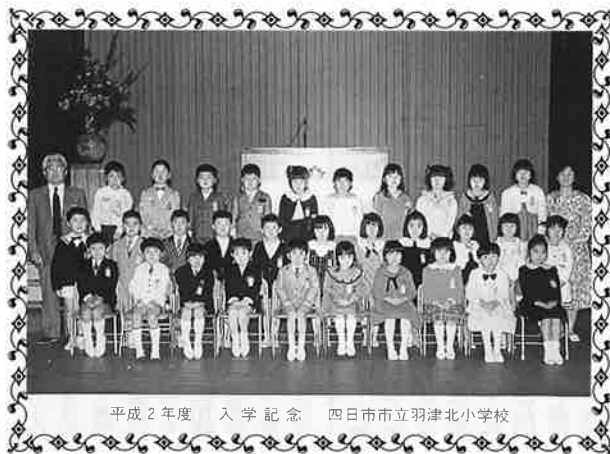
平成2年度 入学記念 四日市市立羽津北小学校