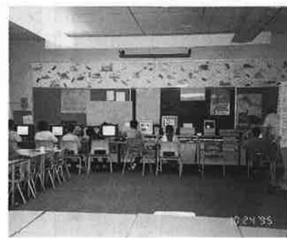
コンピューター導入授業

子ども達は自由にどここの場所でもやってもいいし必要なら友達と話しかけてもいいのですが先生が話す時にはとても静かになるのには感心させられた。先生はほとんど板書はしないので話を聞かなければわからないのである。またカナダはコンピューターを大いに授業に導入しており幼稚園のクラスか