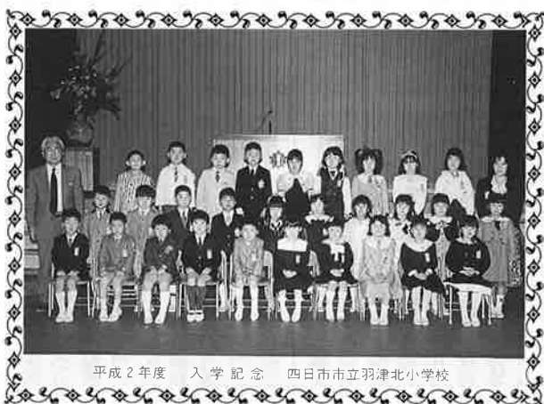
平成2年度 入学記念 四日市市立羽津北小学校