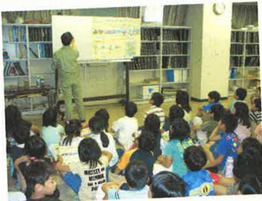
4年生 社会見学 6月29日 下水処理場