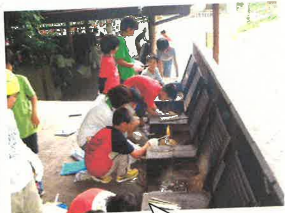
5年生 自然教室 6月27日 ～ 6月28日