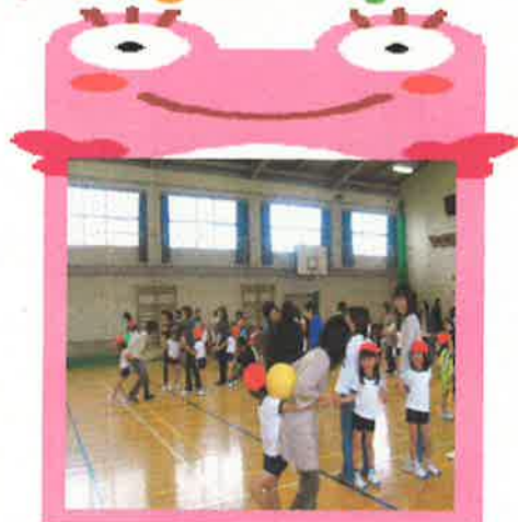
一年生 おんぶリレー

本年度の当初に、『子どもをあいさつで育て、生活リズムを向上させる』ことをPTA活動の大きな目標の一つに掲げて参りました。この一年「あいさつ週間」や「ろうか歩行週間」を学校教育の中に設定していただき、子ども達が年度初めよりも大きな声で気持ちよくあいさつが出来るようになった感をおおいに覚えるこの頃です。日々の小さな活動の積み重ねがいかに大切かを実感する一年となりました。同じことが家庭にも言えるのではないのでしょうか？保護者が曰くろに、子ども達への声掛けの仕方一つで随分成長が大きく変わってくるはずです。各ご家庭でも子ども達が今後も続けて気持ちよいあいさつや生活リズムを身に付けられるよう、さらなる「指導をお願いいたします。『継続は力なり』です。