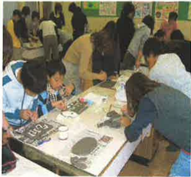
六年生 親子陶芸教室