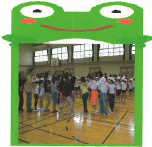
三年生 コミュニケーションゲーム