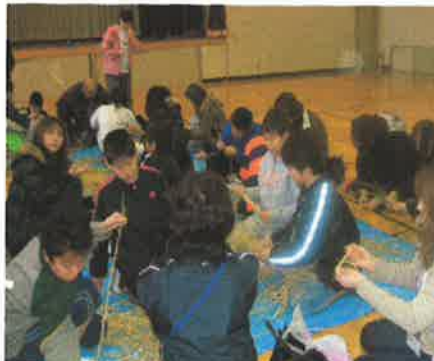
五年生 しめ縄作り