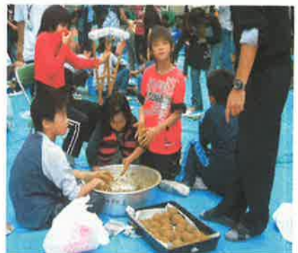
四年生 EMだんご作り