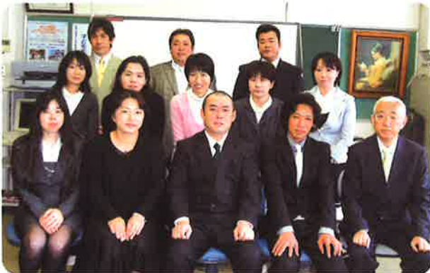
平成23年度本部役員

この1年PTA活動を通して、保護者と教職員が連携し、子どもたちが楽しく有意義な学校生活を送れる支援が出来ればと思います。